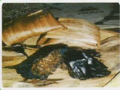
Kue Lompong KEC. KUTOARJO, PURWOREJO