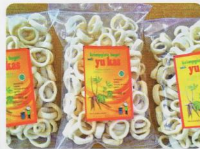
Krimpying Ketela Kec. Bagelen