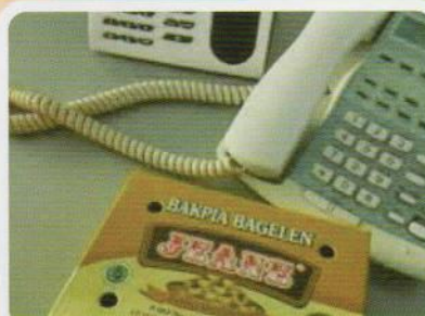
Bakpia Jeans Ds. Bagelen Kec. Bagelen